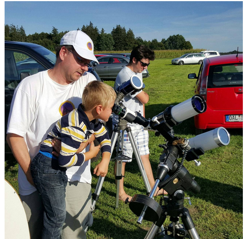
Sonnenbeobachtung bei den 18. Astronomietagen 2015